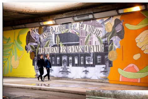
Fresques éphémères (SPL Lyon part-Dieu) Hôtels Vivier Merle, Rue de bonnel et Passage POMPIDOU.

Article proposé et Rédigé par Xavier LAURIAT LEANDRI